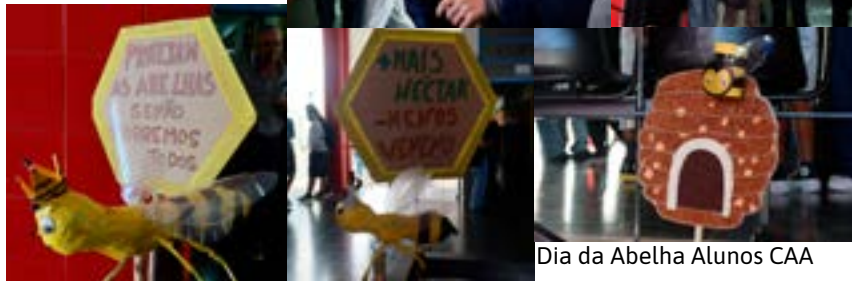
Dia da Abelha Alunos CAA