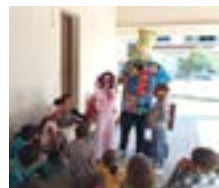
Reciclar para o planeta preservar