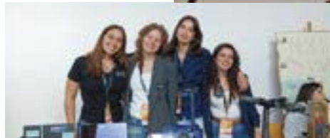
Junior Achievement Portugal