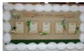
Eco-Escolas_Dia da Terra-Campanha Internacional