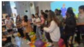
Encontro intergeracional Centro de Dia da GBH