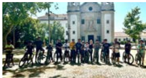
Passeio pelos trilhos da Vista Alegre do GE de BTT-XCO do AEV