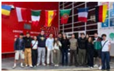
Sessão Acabei o Secundário. E agora?