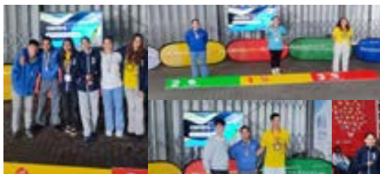
Canoagem do AEV