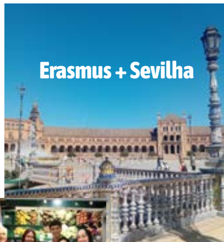
Erasmus + Sevilha