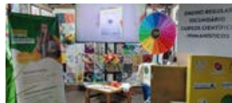
AEVagos nas Festas do Município