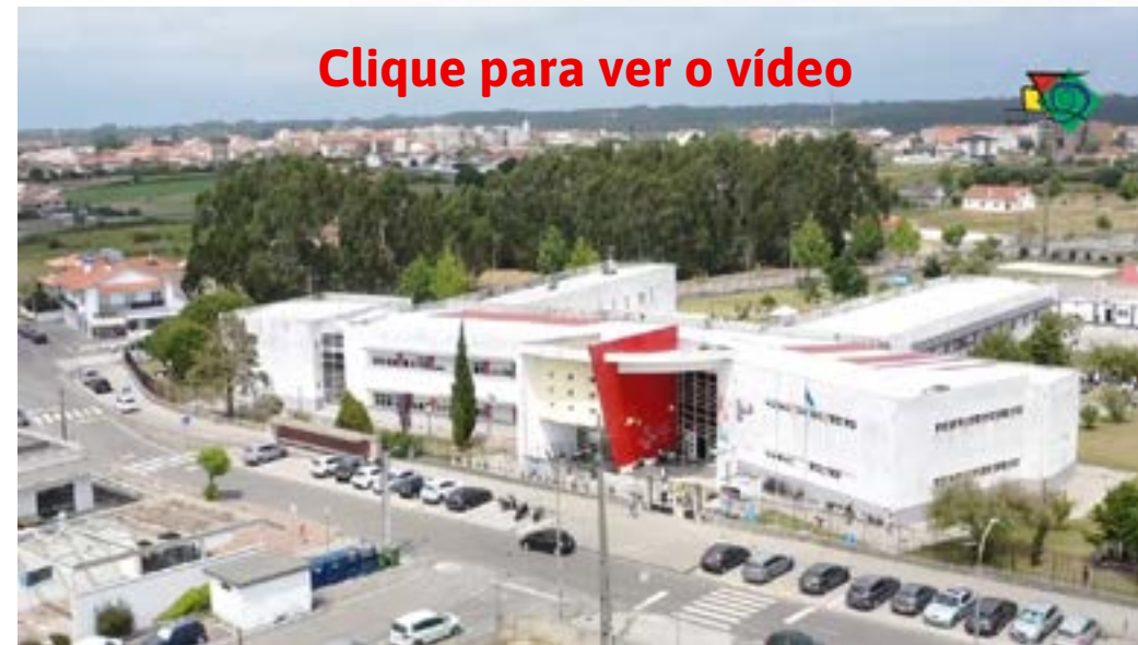
Clique para ver o vídeo

O Conselho Geral manifesta publicamente o seu reconhecimento pelo sucesso do Dia do Agrupamento. Esta celebração reflete a vitalidade da nossa instituição e resulta do planeamento das nossas equipas de organização, do trabalho diário e do esforço concertado de todos para levar a cabo com pleno êxito este evento marcante.