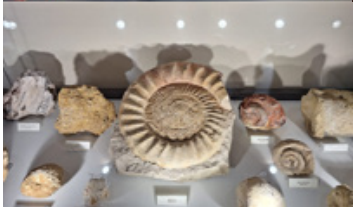
Visita de estudo ao Centro de Interpretação da Batalha de Aljubarrota (CIBA) e às Grutas da Moeda