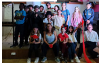
“Do Outro Lado da Gaiola” Teatro no âmbito das comemorações do 25 de Abril