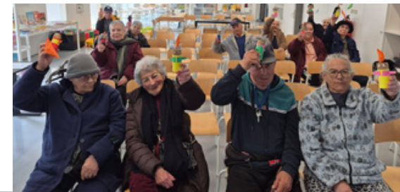
BE do CE da BH junta o 4.º ano e os seniores