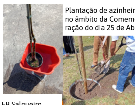
Plantação de azinheira no âmbito da Comemoração do dia 25 de Abril