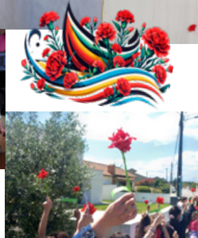
25 de Abril – Salgueiro